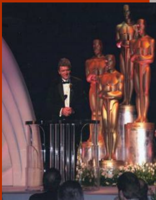
Лев Николаевич получает «Оскар». 2006 г.